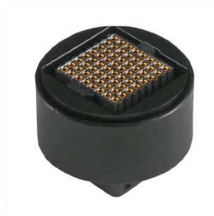
Abbildung 2: Baustein aus dem EasyKit-Baukastensystem

Entwicklung zu beschleunigen, wird auf ein Hardware-Baukastensystem zurückgegriffen, mit dem schnell Prototypen einer Steuerungen aufgebaut werden können. Auf dem vorliegenden Basisboard stehen zwei Sockel zur Verfügung, auf die die kleinen schwarzen Bausteine des Baukastensystems (vgl. Abbildung 2) aufgesteckt werden können. Die Bausteine ordnen dabei E/A-Pins des Controllers den Ein- und Ausgängen auf den Klemmleisten zu und fungieren zusätzlich als Schutzbeschaltung.